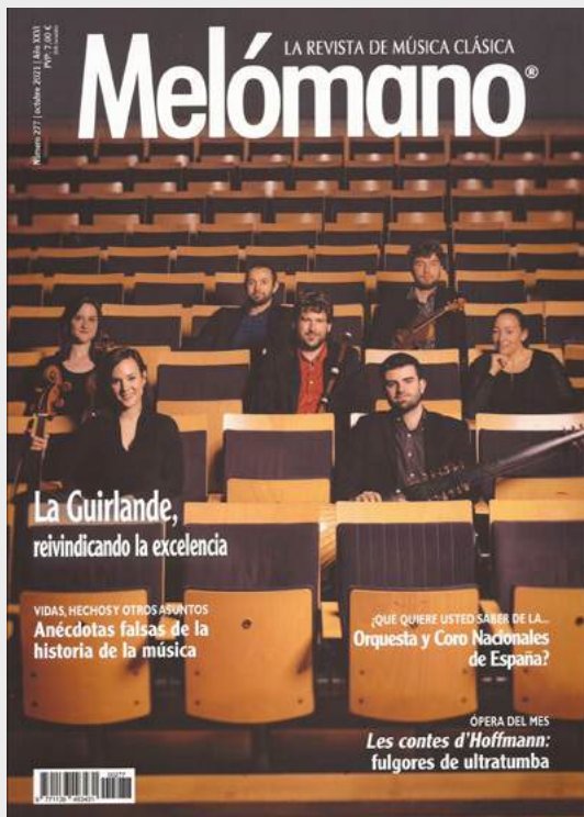
La Guirlande. Portada de la revista Melómano. Octubre 2021