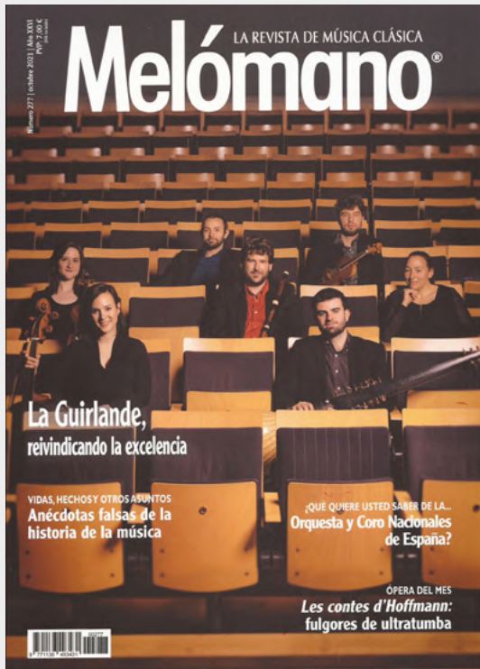
La Guirlande. Portada de la revista Melómano. Octubre 2021