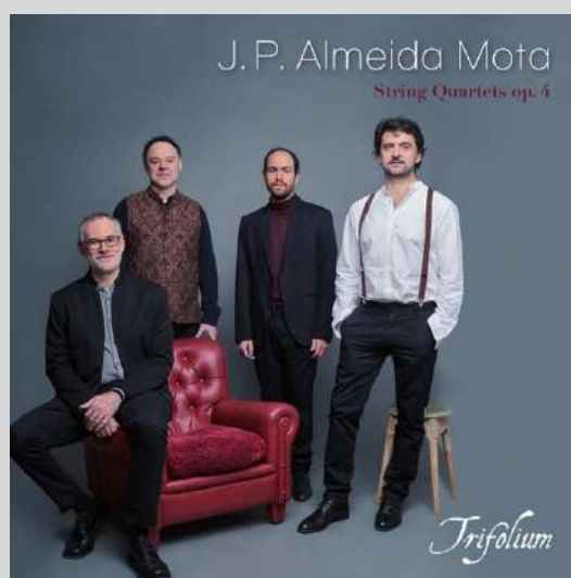
J. P. Almeida Mota: Cuartetos de cuerda Op. 4