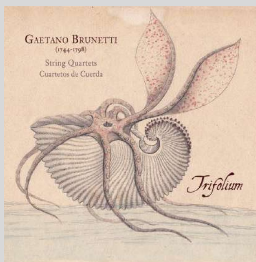
Gaetano Brunetti: Cuartetos de cuerda