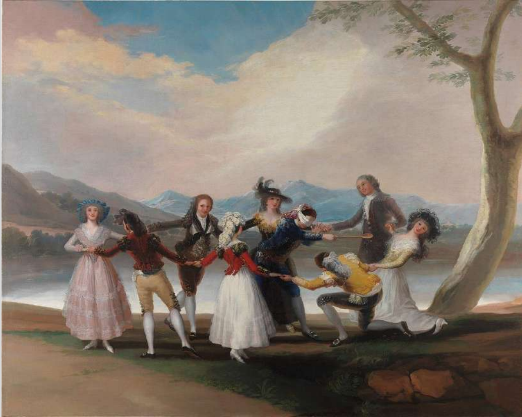
F. Goya: La gallina ciega (1789)