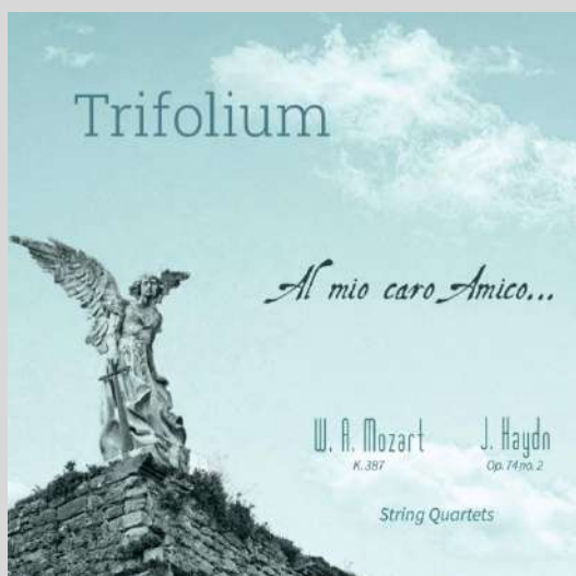
W. A. Mozart – J. Haydn: Cuartetos de cuerda